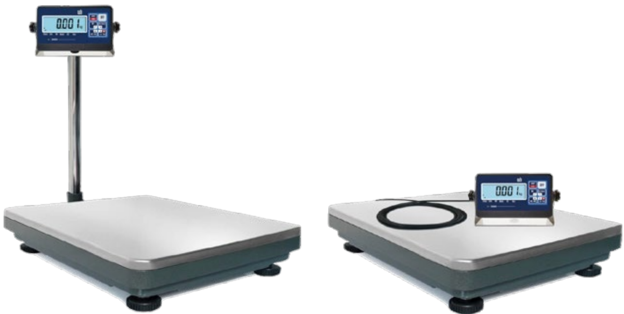
Piano di pesatura e supporto indicatore in acciaio inox

Struttura: Piattaforma monocella in Alluminio presso fuso, piano di pesatura in acciaio Inox lavabile e removibile. Cella di carico in Alluminio a norme OIML R60 C3 IP67. Cavo di collegamento schermato completo di connettore per raccordo al visore (lunghezza 2m)