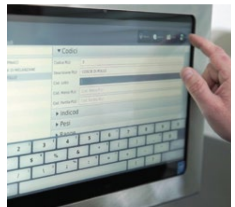
SCHERMO TOUCHSCREEN 15" DOTATO DI SOFTWARE DI GESTIONE / 15 " TOUCHSCREEN SCREEN EQUIPPED OF MANAGEMENT SOFTWARE.