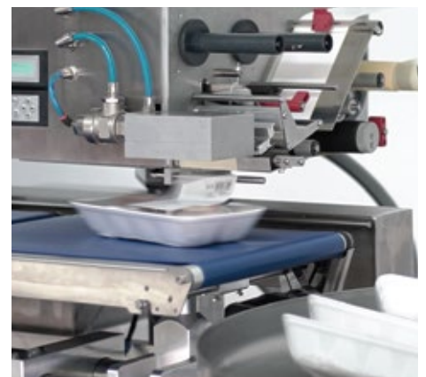
APPLICATORE DI ETICHETTA AIR BLAST / AIR BLAST LABEL APPLICATOR